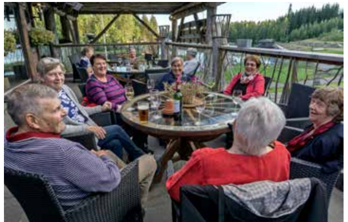
HakoApaja, Järvisydän. I glatt samspråk före middagen i Järvisydän. Tv. Nya Valamo kloster i Heinävesi. Lunch i Kenkävero.