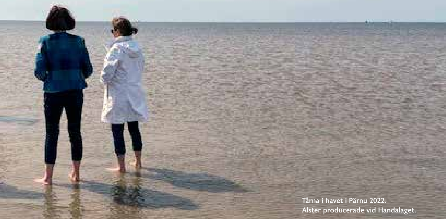
Tärna i havet i Pärnu 2022. Alster producerade vid Handalaget.

merfors där vi såg "Anastasia", ordnat information för sina nya medlemmar, effektiviserat sin motionsverksamhet och arrangerat tre fredagsträffar, varav en besöktes av rekordantalet 140 medlemmar. Seniorbion i februari besöktes av 150 personer, Pubträffen lockade ett tjugotal och vinträffen ett trettital medlemmar. Vi firar utvecklingen vid den kombinerade vår- och femtioårsfesten på Kåren i maj och höjer en skål för fortsatt framgång för ÅSP. ■