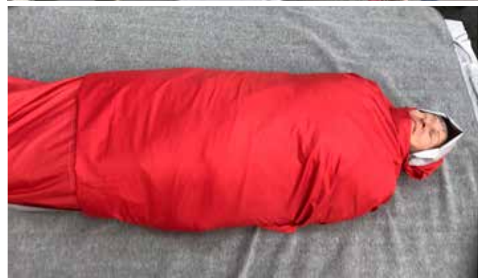
Praktisk övning under Första hjälpen -kurs.