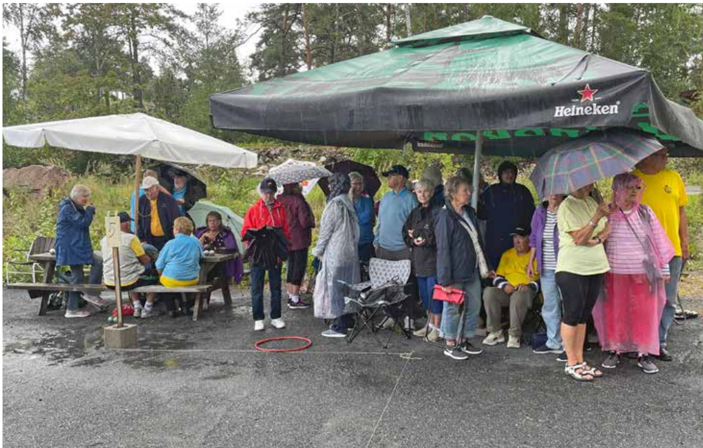
Petanque i Västanfjärd i ösregn

2022 spelades det åbolandska mästerskapet i Västanfjärd och Korpo tog täten och bästa lag från Åbo blev 14:e av 26 deltagande lag. Att spela petanque innebär att man får motion, lättare visserligen men ändå. Under de två timmar långa spelpassen varar rör man sig många gånger av och an på spelplanen. Det är inte ovanligt med över 1000 steg under spelet. Ett viktigt inslag i gruppens verksamhet