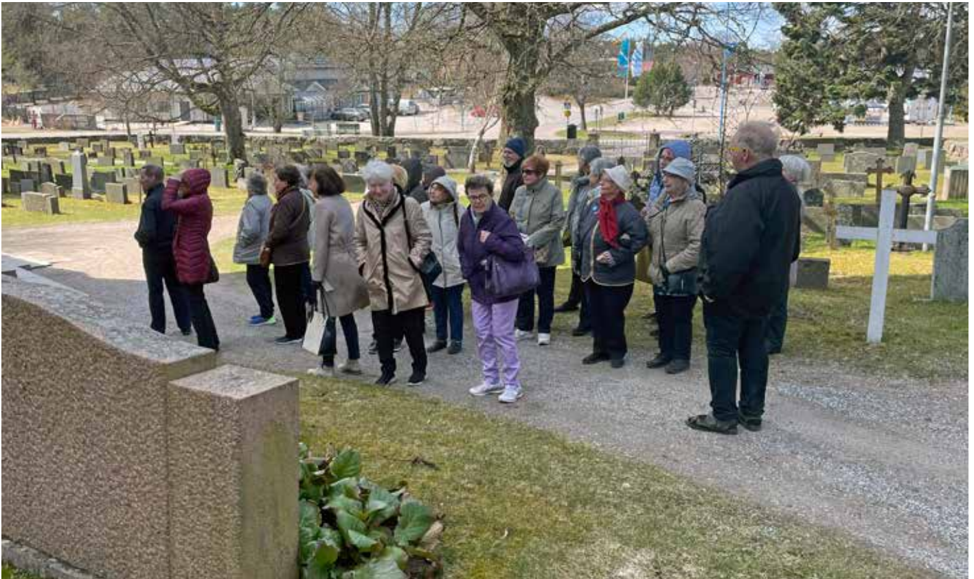
Guidad rundtur på Åbo gamla begravningsplats under pandemitiden.

”Mellan broarna – mitt i Åbo”, hela 600 ivriga pensionärer deltog.