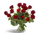
Tack till alla!